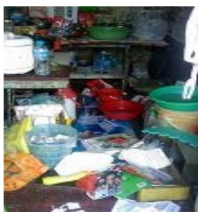
被非法抄家后的厨房

【明慧网】我是辽宁葫芦岛市一名修炼了十几年的法轮功学员,在中共迫害法轮功期间多次遭受迫害,工作单位为此给我开除厂籍留厂察看的无理处分。我在单位是大家公认的好人,这一点就连当初绑架我的警察都承认,因为在绑架我之前他们曾经到我单位调查过。正因为如此,迫害之初,警察们没有对我施以拳脚。后来我被两次非法劳教。出来后,我在单位申请了长假,到外地打工,在一家合资企业的食堂当厨师兼管理员,也就是连买带做。