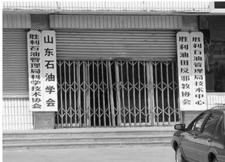
位于胜泰路东首的油田“反邪教协会”

恶毒攻击法轮功的邪恶组织，事实上是一个地地道道的“邪会”（以下简称邪会）。该邪会在油田自成体系、自成网络、经费独立，在全油田设立十九个分会，配有专人，覆盖了整个油区。该邪会直接操纵、部署二级分会及其相关机构开展迫害活动，下达各种要求和指令，有常设机关，实施各项迫害活动，同时操控油田相继建立的胜采、集输、供应处洗脑班。由于该邪会没有任何其它职能，唯一任