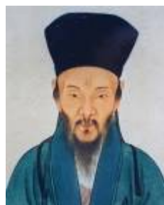
图：明朝思想家、教育家王阳明

不久，王华果然状元及第，后官至吏部尚书，娶妻郑氏，夫唱妇随。王阳明出生时，他的祖母曾梦见屋上仙乐齐鸣，旗幡招展，一群仙人驾着祥云送一小孩儿来家，并听到一天神高叫：“贵人来也”，随后仙人们驾起彩云而去。他的祖母忽然惊醒并听到了啼哭声，这时侍女报郑夫人已产