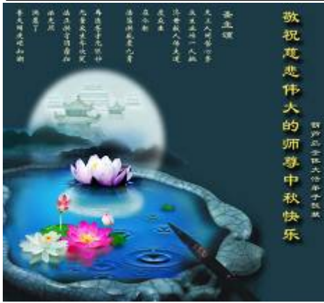
图：大陆法轮功学员 2010 年中秋节以贺卡表达对李洪志师父的问候和感恩