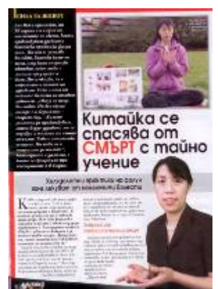
图：《女士周末》发表专访法轮功学员的文章

党员的人数。法轮功没有人员名单，所以很难统计世界上共有多少人修炼。“法轮功既不是宗教，也不是政治。”刘