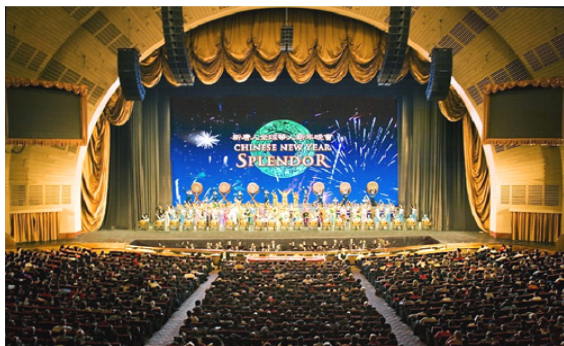
▲无线电音乐城全球华人新年晚会现场谢幕盛况。