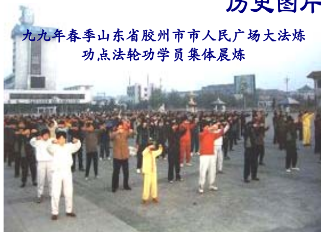
九九年春季山东省胶州市市人民广场大法炼功点法轮功学员集体晨炼