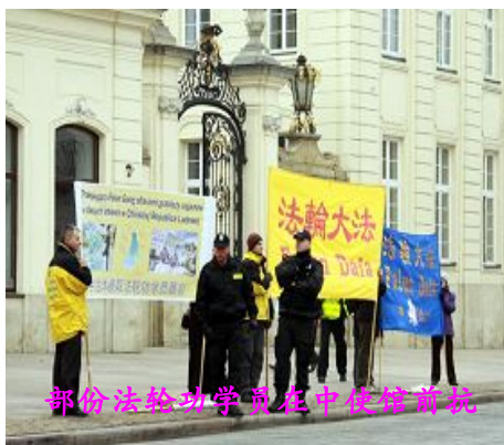
部份法轮功学员在中国使馆前抗议

【明慧网】二零一零年十一月二日，中共迫害法轮功的积极参与者之一的贾庆林访问波兰。当天上午，部份波兰法轮功学员就来到中国大使馆门前拉起横幅，支起展台和展板，抗议迫害法轮功的罪犯进入波兰。