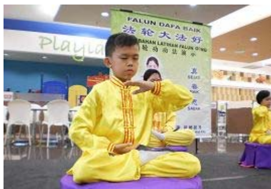
法轮功小弟子在超市的舞台上做静功表演

有时学员们会在超市的舞台上展示功法，或表演腰鼓；有时会在柔佛州麻河集体炼功洪法。每当学员们在超市或户外活动时，都会引起人们驻足观看，不时有人表示要学功，及愿意听取学员和他们讲真相；也有人立即希望可以买到大法书籍。