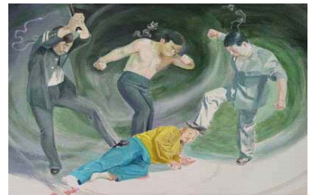
监狱恶警对法轮功学员施暴演示图