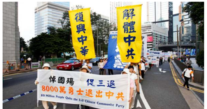
■10 月 1 日香港声援国内 8000 万勇士退出中共

安徽的一名公安人员来电话讲：他们局负责迫害法轮功的副局长年底刚被评为局先进，今年除夕那天，突然全身剧烈疼痛，精神错乱，从自家的三楼跳楼自杀了。这件事在局里和当地震动非常大，对他自己和家人触动也很大。他自己以前不情愿的跟着做了一些坏事，这件事使他清醒了，真是善恶有报哇。他说：“我不能再和它们同流合污了，我要改头换面重新做人，决定声明退出这个邪党，我们全家，妻子和两个孩子他们也决定发表声明退出来。”他还说退党服务中心给了他一个重新做人的机会，表示感谢！