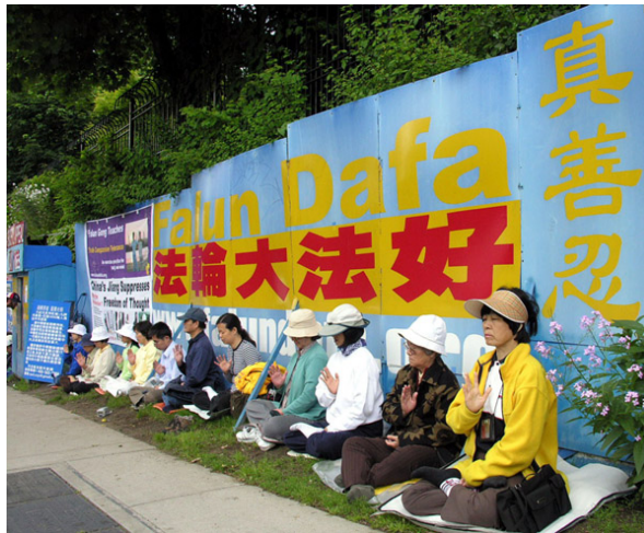
■ 温哥华法轮功学员在中领馆前抗议中共迫害已持续九年

村民们感慨地说：共产党就是不如炼法轮功的，几年来路都不能走了无人过问，看看还是人家炼法轮功的啥也不图把路修好了，往后谁再迫害炼法轮功的我们可不答应。有的村民干脆说：往后这条路就叫“法轮功路”！一句话表达了乡亲们最纯朴的赞许。