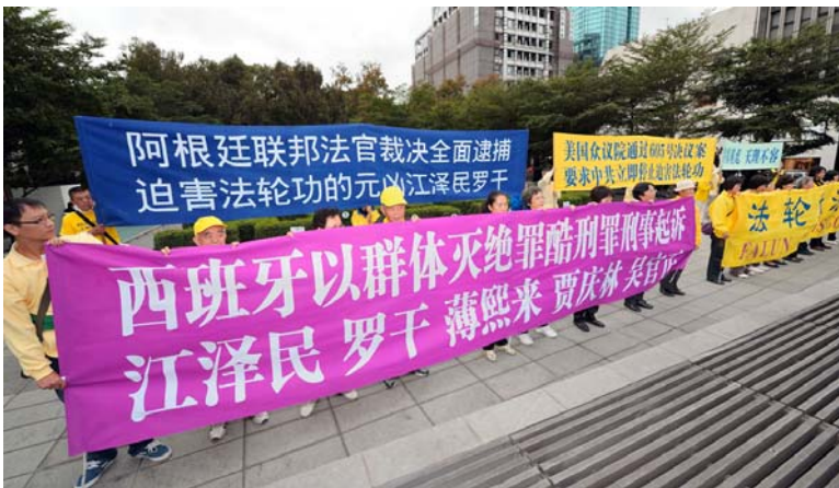
图：法轮功学员在台北晶华酒店前打出的横幅