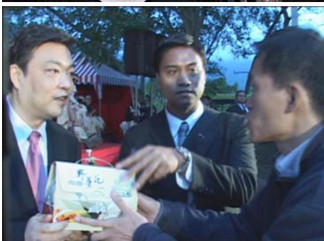
图：吉林两次接到法轮功学员递诉状