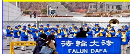
天国乐团演奏《法轮大法好》等乐曲

【明慧网】二零一零年十二月五日下午，韩国天国乐团在首尔著名的梨花女子大学正门前演奏《法轮大法好》等乐曲，大陆游客争睹韩国天国乐团的风采。