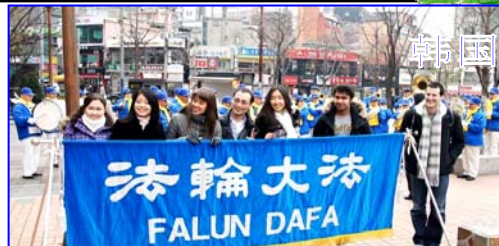
游客们在“法轮大法”横幅前拍照留念

中国传统文化也在这里弘传。法轮功又称法轮大法，修炼者以真、善、忍为准则，修心向善做好人。一九九八年在哥本哈根的第一期法轮功学法班后，学法炼功，修心向善，修者日增。一九九九年七月二十日，中共与江氏集团动用整部国家机器迫害法轮功，对遵循“真、善、忍”的法轮功学员发起了残酷的迫害，也把黑手伸到海外。然而明白了真理的人们不会被暴力和谎言改变正信理念，法轮大法在海外弘传一百多个国家，二零零一年十月十五日丹麦法轮大法协会正式成立。