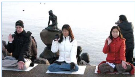
■ 丹麦法轮功学员在美人鱼雕像前

世界闻名的“美人鱼”铜像坐落在哥本哈根长堤海滨公园。在那里的一块巨大的岩石上，与真人一般大小的“小美人鱼”，从一九一三年至今已经静静的坐在那里遥望着大海度过了九十七个春秋。在这著名的历史名城哥本哈根，古老的