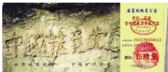
图：位于贵州省平塘县掌布风景区内的救星石景区的“藏字石”，石头上清晰可见的六个字是：中国共产党亡（此图为风景区门票）。

公平公正，这就像法；装入量器，一定保持水平，这就像正；它周到得无所不至，该到的地方，它都流到了，这就像明察；它无论发源何处，即使经历万千曲折也一定要向东流，这就像有志向；它可出可进，无论到哪里，都能把那里的万物净化，这就像是善于教化。这些就是君子见到大水一定要看的原因吧。”