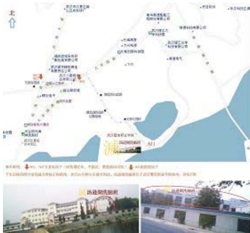
上图: 湖北省洗脑班