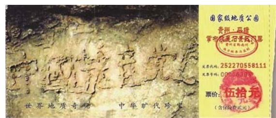
图：位于贵州省平塘县掌布风景区内的救星石景区的“藏字石”，石头上清晰可见的六个字是：中国共产党亡（此图为风景区门票）。

公平公正，这就像法；装入量器，一定保持水平，这就像正；它周到得无所不至，该到的地方，它都流到了，这就像明察；它无论发源何处，即使经历万千曲折也一定要向东流，这就像有志向；它可出可进，无论到哪里，都能把那里的万物净化，这就像是善于教化。这些就是君子见到大水一定要看的原因吧。”