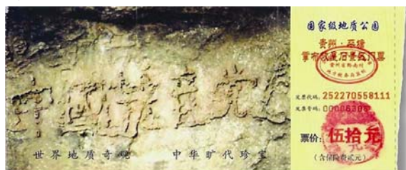
图：位于贵州省平塘县掌布风景区内的救星石景区的“藏字石”，石头上清晰可见的六个字是：中国共产党亡（此图为风景区门票）。

【明慧网】孔子是我国春秋时期的思想家、教育家，非常重视道德教化，善于从普通的事物或者现象中发现隐含其中的道理，善化他人。他通过对最平常的水的观察、感悟和思考，以伦理道德思想为切入点，来阐发对水的深刻理解和认识，给人以智慧的启迪。