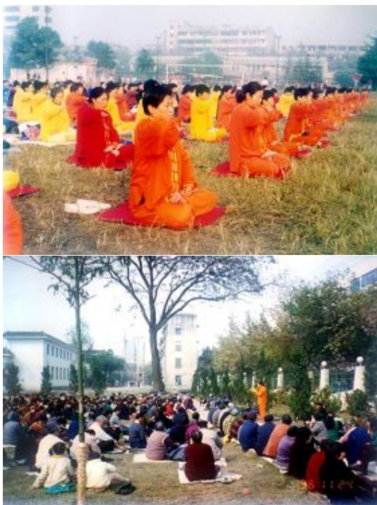
上图：1998 年 8 月 8 日，法轮功学员在常德市老体育广场集体炼功。