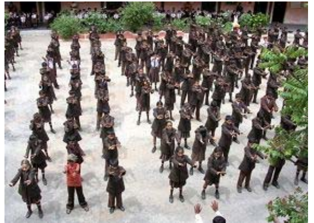
图：印度班加罗尔 CHINTAMANI 镇的 JYOTHI SCHOOL 学校学生集体炼功

在一次“全市在岗、离退休公、检、法人员会议”上，当会议快结束时，会议主持人问大家：“谁还有什么事？”这时，一位七十多岁、在全市公安司法界很有威望的、已退休的法院老院长站起来严肃的说：“我有事儿！有个问题请教大家。首先声明，我没炼法轮功。都说法轮功‘邪’，我就没弄明白法轮功到底‘邪’在哪里？哪位给我说说？”