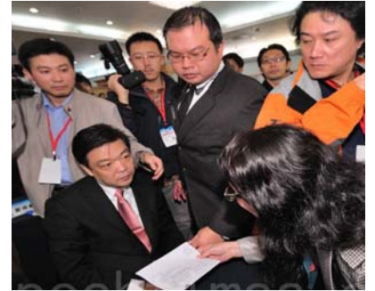
图: 中共北京副市长吉林在数百人的会场上, 对递到眼前的诉状一脸愕然。

(明慧记者郑语焉台湾台北报导) 积极参与迫害法轮功的中共北京副市长吉林, 12 月 13 日抵台, 15 日在台中与新竹两地亲自接获刑事诉状后, 突于晚间七时离开台湾。这是 2010 年 8 月以来, 继广东省长黄华华、陕西代省长赵正永、宗教局长王作安以及湖北省委书记杨松之后, 又一个残酷迫害法轮功的中共官员狼狈离开台湾。