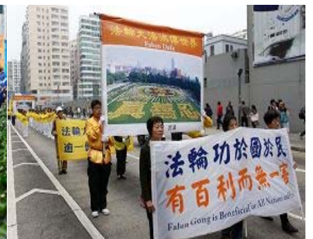
左图：多名社会各界知名人士在集会上发言 中图：法轮功学员的天国乐团游行队伍 右图：展示法轮大法弘传图片