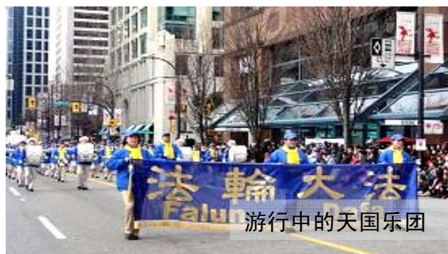
游行中的天国乐团

当天国乐团吹奏“法轮大法好”、“法鼓法号震十方”、“法正乾坤”、“送宝”等乐曲时，街道两边的观众仿佛都