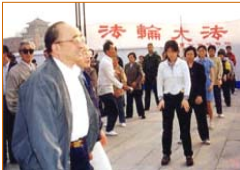
■国家体育总局局长伍绍祖赴法轮大法发祥地长春考察（98年5月15日）