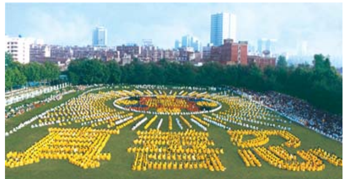
历史图片：1997 年武汉 5000 多名法轮功学员集体炼功，列队组字，法轮图形和“真善忍”。