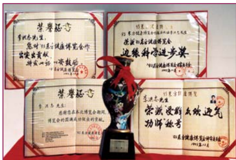
■李洪志先生荣获 93 年健康博览会“边缘科学进步奖”和“受群众欢迎气功师”称号