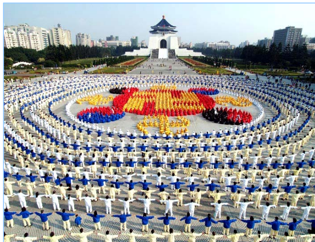
法轮大法弘传台湾：4 千多名法轮功学员在台北市中正纪念堂广场前排组法轮图形（2005.12）

至今，法轮大法已弘传世界 110 多个国家和地区，获各国政府褒奖、支持议案信函 3000 多项。法轮功的主要书籍《转法轮》被翻译成 30 多种语言文字，在全世界出版发行，并可从互联网上免费下载。《转法轮》成为世界上流行最广的书籍之一。