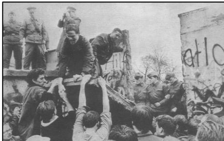
1989 年 11 月柏林墙被拆除的瞬间

故事发生在柏林墙倒塌之后的德国。一九九二年二月，统一后的柏林法庭上，举世瞩目的柏林围墙守卫案将要开庭宣判。这次接受审判的是四个年轻人，都三十岁不到，他们曾经是柏林墙的东德守卫。