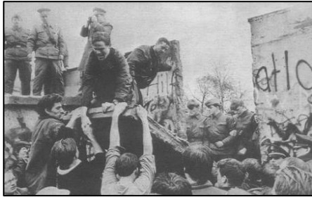
1989 年 11 月柏林墙被拆除的瞬间

故事发生在柏林墙倒塌之后的德国。一九九二年二月，统一后的柏林法庭上，举世瞩目的柏林围墙守卫案将要开庭宣判。这次接受审判的是四个年轻人，都三十岁不到，他们曾经是柏林墙的东德守卫。