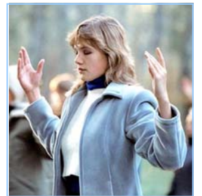
俄罗斯法轮功学员炼功

老母亲打开《转法轮》，指着李洪志大师的照片接着说：“我当时对那些话感到奇怪和不解，现在我才明白，那个老人说的拯救众生的‘带轮子的男子’就是他！这是一本好书，你好好学，好好炼吧。”（文/俄罗斯法轮功学员）