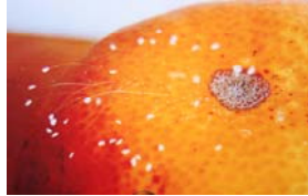
2008 年 11 月，湖南省辰溪县一法轮功学员的柑橘树结的一个桔子和一个橙子上开了多朵优昙婆罗花。

继韩国之后，优昙婆罗花更在台湾、香港、新加坡、澳大利亚等世界各地处处盛开。而近年在中国大陆各省市更是频频绽放。