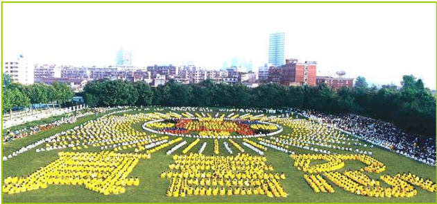
1997 年武汉 5000 多名法轮功学员炼功，排组法轮图形和“真善忍”字样。

泰国著名爱国华侨泰亿利有限公司总经理钟奕江先生，原患有视网膜黄斑病变，是中西医都棘手的不治之症，李老师曾破例为其调治，让他闭眼后，几分钟内高功能治疗，一次彻底治愈，没收分文报酬。一九九九年十月一日中国北京国庆大典时，钟先生是天安门观礼台的海外来宾之一，当国家全部官员向他询问法轮功之事，他坦承上述事实。钟先生至今仍在修炼法轮功并同意将此事实公开报道。