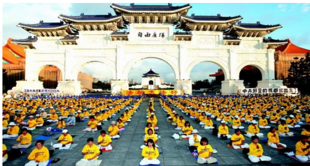
■ 2008年11月4日，三千多名台湾法轮功学员在台北自由广场前炼功，抗议中共迫害法轮功。

其实专制独裁者从来都不懂修炼者的心！他们可怜的、狭隘的只会用政治权术的有色眼镜看人、看事。一个强制专横、极端自私的人，怎能理解无私与善的强大感召力呢？