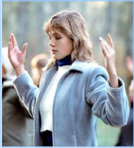
俄罗斯法轮功学员炼功

“那是几十年前的事儿，我当时很年轻，那时我们村里住着一位老人，常给人占卜，能预知未来。有一次他给我占卜的时候告诉我说：将来人类会有很多灾难降临，到时会有各种可怕的疾病和天灾！那时在人间会出现一位‘带轮子的男子’拯救众生，届时地球上只有他一个人做这件事。”