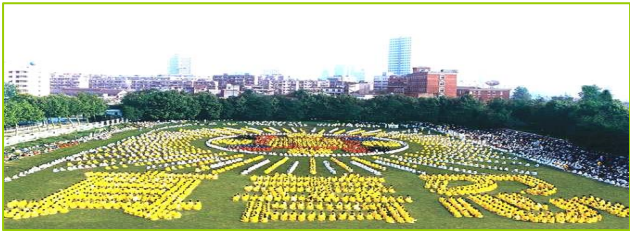
1997年武汉 5000 多名法轮功学员炼功，排组法轮图形和“真善忍”字样。

泰国著名爱国华侨泰亿利有限公司总经理钟奕江先生，原患有视网膜黄斑病变，是中西医都棘手的不治之症，李老师曾破例为其调治，让他闭眼后，几分钟内高功能治疗，一次彻底治愈，没收分文报酬。一九九九年十月一日中国北京国庆大典时，钟先生是天安门观礼台的海外来宾之一，当国家全部官员向他询问法轮功之事，他坦承上述事实。钟先生至今仍在修炼法轮功并同意将此事实公开报道。