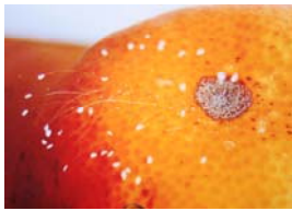
2008 年 11 月，湖南省辰溪县一居民的桔树结的一个桔子上开了多朵优昙婆罗花。

继韩国之后，优昙婆罗花更在台湾、香港、新加坡、澳大利亚等世界各地处处盛开。而近年在中国大陆各省市更是频频绽放。