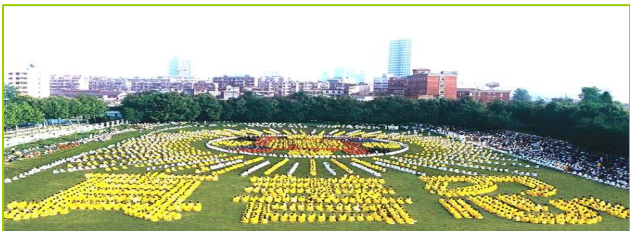
1997年武汉 5000 多名法轮功学员炼功，排组法轮图形和“真善忍”字样。

泰国著名爱国华侨泰亿利有限公司总经理钟奕江先生，原患有视网膜黄斑病变，是中西医都棘手的不治之症，李老师曾破例为其调治，让他闭眼后，几分钟内高功能治疗，一次彻底治愈，没收分文报酬。一九九九年十月一日中国北京国庆大典时，钟先生是天安门观礼台的海外来宾之一，当国家全部官员向他询问法轮功之事，他坦承上述事实。钟先生至今仍在修炼法轮功并同意将此事实公开报道。