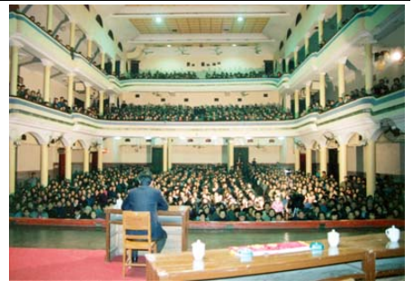
李洪志先生在武汉第二期传授班上传功（1993.3）

有一天从十二期班下课回家，在五棵松地铁站等车，看到老师从后面走来，旁边有他的家人，还