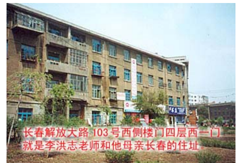
李老师在长春的住宅

忽然，这位长春学员指着远处说：“快看，那是老师的家！”我们顺着她手指的方向望去，是一栋极普通的没贴面的砖楼，顶多四、五层