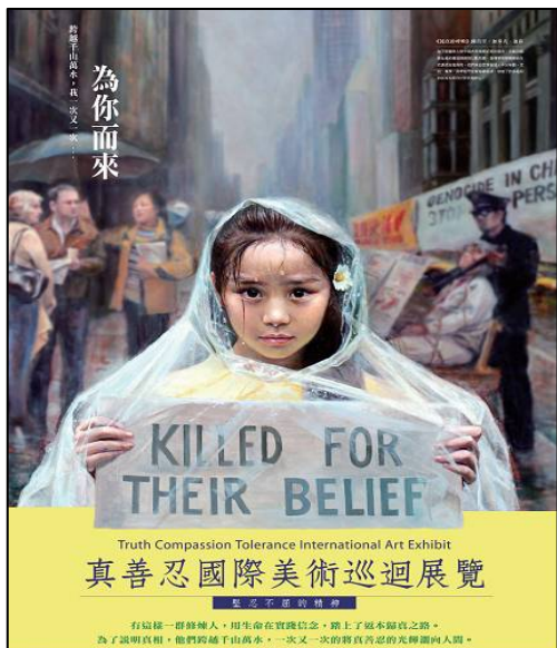
『真善忍』国际美展作品 《纯真的呼唤》