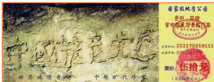
▲下图是贵州平塘“藏字石”风景区的门票。

从 99 年 7.20 迫害开始到现在十年的时间当中，我家被恶人所诈骗的钱财和抢劫的各种贵重物品价值达两万多元。