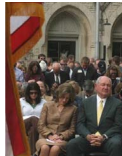
■普度夫妇在祈雨仪式上虔诚祷告

近年来大陆各种天灾人祸层出不穷，这已经是上天对中共的谴责。而很多中外预言都提到，天灾中共时会有一场更大的灾难来临。如何才能平安度过劫难？如今已经有超过 6800 万的中国同胞做出了理智的选择——退出中共党、团、队组织，废除了把生命献给中共的毒誓。生命极其珍贵，机缘也许只有一次，在中共气数将尽之际，希望同胞们都能顺应天意，远离灾难，选择平安。◇