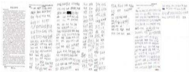
申诉人共 376 位村民签名（签名图片）

所有的人都关注，并询问大为家属案子进行到哪了。然而中共司法机关仍想以“证据不足”为辞，对于监狱犯罪行为不予调查处理。据了解，徐大为家属向各级政府机关投递甚至上门递交联名申诉信，可是看到的，不是政府官员积极解决，而是他们紧张恐惧的状态，有的官员还威胁大为家属，不能将此联名信上载互联网。