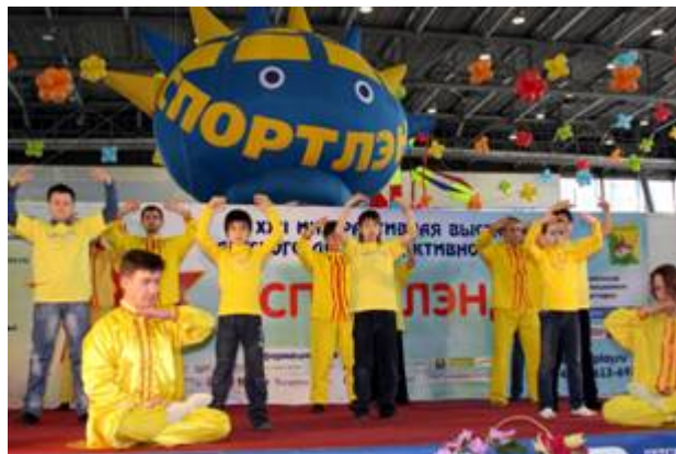
■ 莫斯科“第二十二届儿童体育王国博览会”上的法轮功功法演示

法轮功学员参加了博览会，介绍和表演法轮功功法，教小朋友们叠纸莲花。俄罗斯法轮大法中心因积极参与莫斯科市的社会项目和文体项目，获得博览会组委会颁发的两项褒奖，这是法轮功学员第三次在儿童博览会上获奖。◇