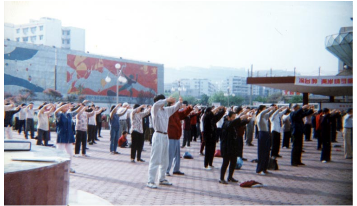
■ 1998 年重庆法轮功学员周末集体炼功

五月十三日是法轮大法师父传法度人的纪念日，也是世界法轮大法日，大法弟子用不同的方式纪念这个日子。2008 年 5 月 12 号，四川汶川发生大地震，邪党栽赃