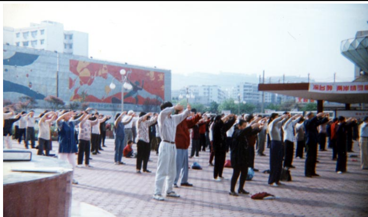
■1998年重庆法轮功学员周末集体炼功

二零零零年三月，他被当时的德感镇政府人员与单位保卫非法押解回来，并非法抄了家，警察没有抄到他们想要的任何东西，随后他被非法送进江津东门派出所关了一夜，第二天被非法关进江津北固门洗脑班，直到五月中旬才放出来。他的养老金从三月到七月一直未发