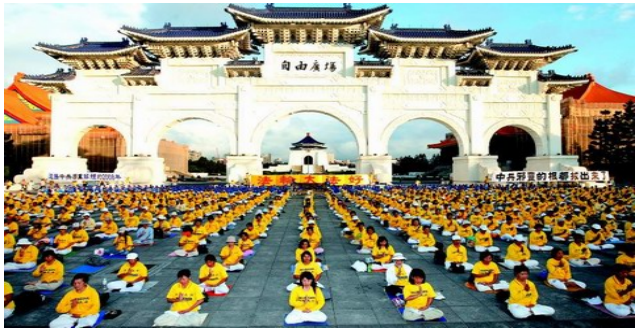
二零零八年十一月四日，三千多名台湾法轮功学员在台北自由广场前炼功，抗议中共迫害法轮功。

1999 年 7 月以来数百万人因坚持信仰而被罚款、降职、停薪，被开除公职和学籍，甚至被非法