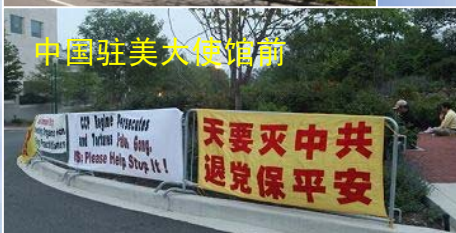
中国驻美大使馆前