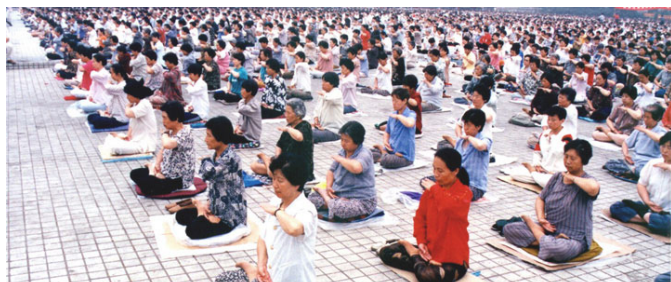
■ 1998年5月，沈阳万名法轮功学员集体炼功

目前法轮功已弘传世界一百多个国家，超过一亿人修炼。法轮功书籍被翻译成三十多种文字在全世界发行。