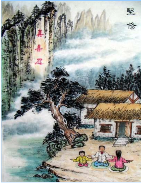
■ 2010 年“5.13”第十一届世界法轮大法日来临之际，大陆及海外法轮功学员纷纷以文章、书法、传统工艺、绘画、摄影、音乐等形式，投稿至明慧网以示庆贺。图为山东法轮功学员创作的水墨画《坚修》。

选村干部时，镇干部表示，最好从法轮功里选拔一些有能力的人才。而村民投票时也表示：选法轮功当村干部我们放心，不贪，不占，不抽烟，不喝酒，不嫖娼，不索贿。当时，全县有不少法轮功学员当村干部。