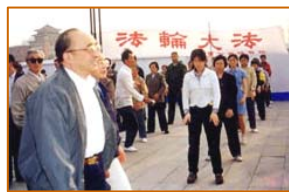
▼ 迫害前大陆媒体的正面报道（《老少皆炼法轮功》羊城晚报 1998.11.10）

查”的同时，还有中共体制内的正义人士对法轮功所作的客观的实事求是的调查。这样的调查一对比，人们就知道谁真谁假了。