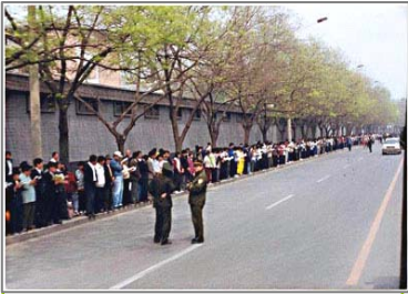
▲历史照片：99 年 4.25 和平上访。照片上，上访群众安静、祥和，警察在一旁聊天，所谓“围攻中南海”根本就不存在

人大退休干部领导的调查结果也没有能让针对法轮功的“整人机制”停止运转。罗干的连襟何祚庠，于九九年四月在天津教育学院办的杂志上发表文章，诽谤法轮功，并且把矛盾放大。天津警察告诉法轮功学员，抓人命令来自北京，只有去北京上访才能解决问题。于是出现了“四·二五”万人上访。