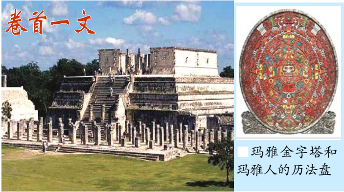
玛雅金字塔和玛雅人的历法盘