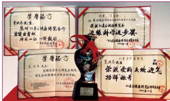
图: 李洪志老师荣获 93 年健康博览会“边缘科学进步奖”和“受群众欢迎气功师”称号