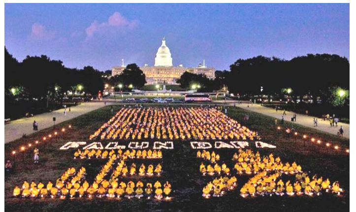
图：海外法轮功学员烛光悼念被中共迫害致死的大陆同修。

二零零四年五月，在所谓刑期快满时，我又被秘密转移，当局出动十几辆警车，冲进来拍照、录像，由于我身体极度虚弱，由两个人架着，他们用手捂住我的嘴巴，怕我喊“法轮大法好”，我被带到沈阳第一看守所，因为身体不合格，被拒收。他们想方设法买通关系，将我送到辽宁省监管医院，在这里我继续喊“法轮大法好”，拒穿囚衣，被铐上手铐，我绝食抗议，被注射不明药物。这期间有两年，我与家人失去联系，在我失踪的日子里，母亲到地方公安局、派出所、办案单位、沈阳马三家教养院四处查询我的下落。在近一年半的痛苦折磨中，我得了中风，精神失常。父亲不堪重压，离家出走，小妹忧愁得现已得了重病，我女儿变得越来越孤僻。