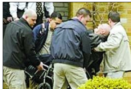
■ 2009 年 4 月 14 日美移民官员将戴姆扬尤克从俄亥俄州的家中带走

人们都希望保持清醒的头脑，为自己的人生做出正确的选择，然而在中共治下的纳粹式的谎言社会里，这真的很难。但是只要您读一读在大陆广传的《九评共产党》，点击一下安全快捷的破网软件，相信您就会走出红墙禁闭，为自己作出明智的选择。◇