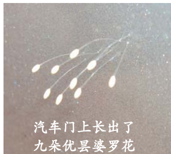
汽车门上长出了 九朵优昙婆罗花

零一年五月，我和工人一起在三轮车上装铁架，不小心掉下来一个，一条腿儿正戳在我左眼睛上，别人都吓呆了，他们叫我赶紧去医院，我说没事的。过了几天不治而愈，连疤痕都没落下。