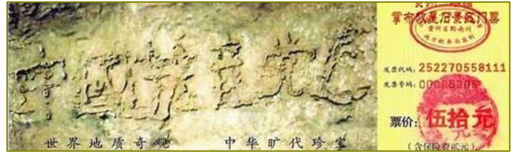
■ 图为贵州省平塘县掌布风景区门票

疫的到来：“贫者一万留一千，富者一万留二三。贫富若不回心转，看看死期在眼前。”《圣经启示录》则明确告诉我们：当举起右拳向邪恶的兽发誓，（只有中共要求人们加入时举起右拳发誓）就会被打上兽印。不能抹去兽印的人，包括其它国家对中共迫害善良视而不见的人都会遭到上天的惩罚。