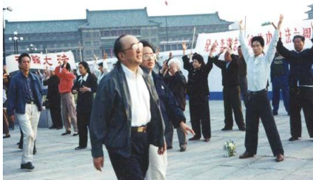
图：国家体育总局局长伍绍祖到长春市文化广场观看法轮功学员晨练

● 法轮大法弘传世界 法轮功已弘传世界114个国家和地区，受到世界人民的爱戴和尊敬。因李洪志先生和法轮大法对人类身心健康作出的杰出贡献，至今获得各国政府褒奖、支持议案信函超过3000项。法轮功书籍被译成30多种语言。自2000年起，李洪志先生连续四年被提名诺贝尔和平奖。