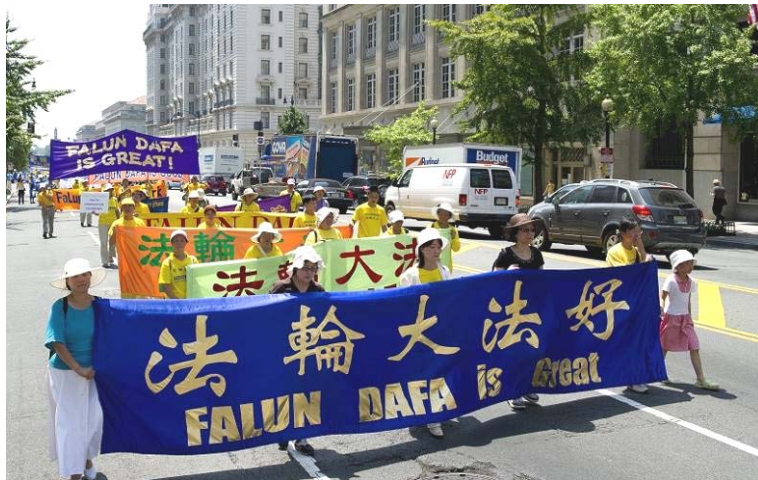
■ 二零一零年七月二十三日，法轮功学员在华盛顿 DC 举行反迫害大游行