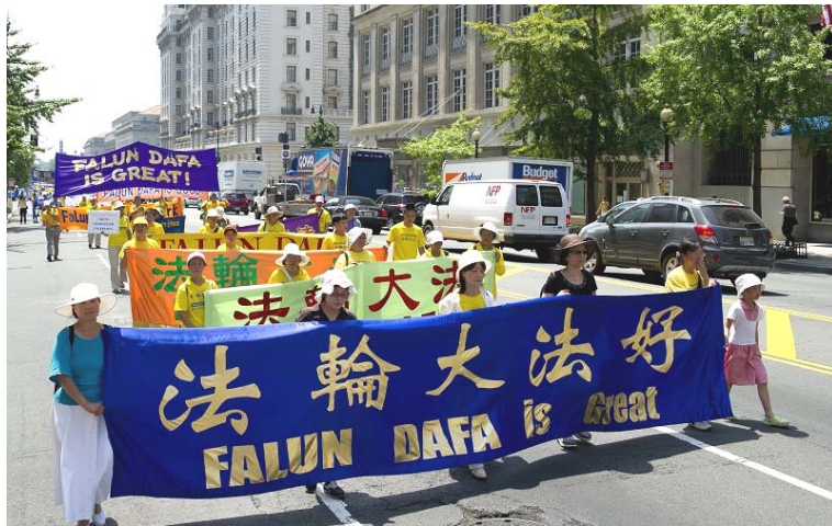
■ 二零一零年七月二十三日, 法轮功学员在华盛顿 DC 举行反迫害大游行