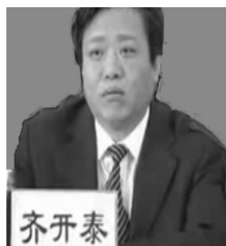
泊头市委书记齐开泰