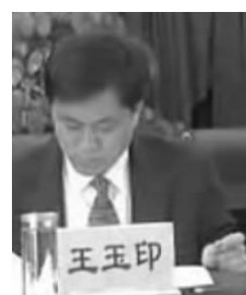
政法委书记王玉印