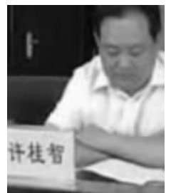
政法委书记许桂智