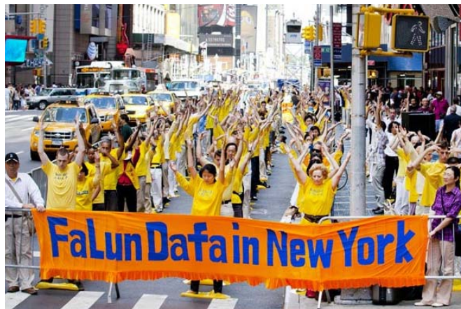
■ 法轮功学员在纽约时代广场集体炼功

一个想做好人的种子，人们应该爱护、培育这颗种子。她觉得，法轮功教人们要“真、善、忍”，而“真、善、忍”鼓励人们去培育心中的那颗种子，为此她心里充满感激。