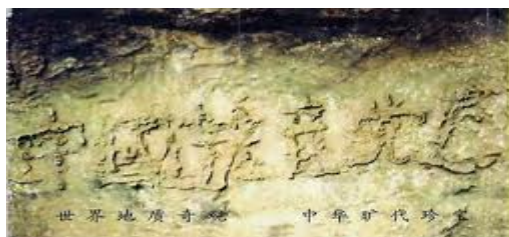
■ 贵州平塘二点七亿年藏字石

相传，在远古的三皇时期，伏羲氏来到通天之河的黄河边，忽见一龙马负图而出，便将其图临摹下来，仰观天文、俯察地理，而作“八卦”，也称“河图”，这就是最原始版的《易经》，其特点是没有文字，以黑白环点示数、排列成图，此图便是神留给世人的遵循上天旨意的方法。后世周文王依据河图推演出文字卦象，所以《易经》也常被称为周易。