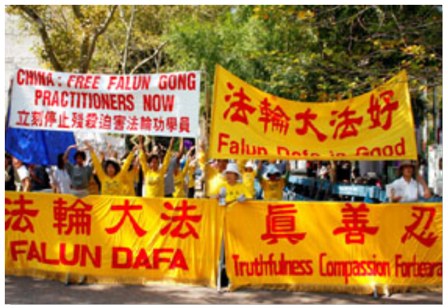
法轮功学员联合国广场上谴责中共迫害