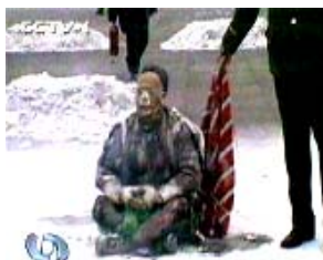
央视自焚伪案镜头