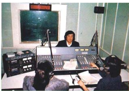
■ 李洪志先生于 1994 年 3 月 18 日在天津人民广播电台热线咨询