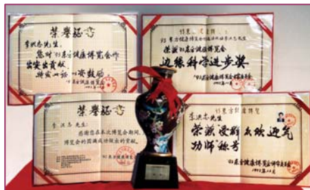
■ 李洪志老师荣获 93 年健康博览会“边缘科学进步奖”和“受群众欢迎气功师”称号