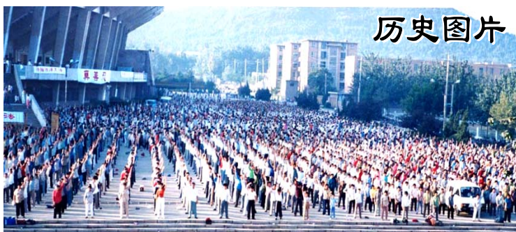
一九九八年十月一日, 济南市近万名法轮功学员在山东省体育中心广场集体炼功, 场面壮观。