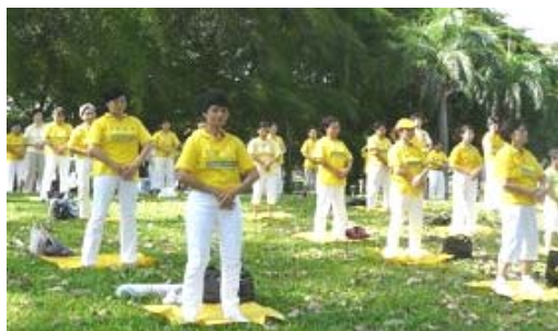
在新加坡公园集体炼功学员

【明慧网】二零一零年八月二十九日下午, 新加坡法轮功学员聚集在东海岸公园举办炼功活动, 整齐排列和祥和炼功场面, 吸引了许多当地民众与外国游客驻足观看。