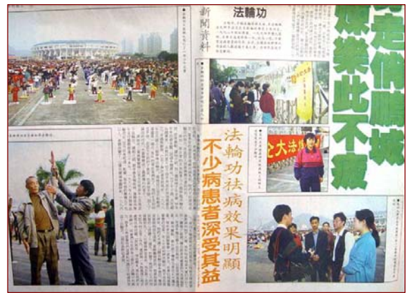
图：《深星时报》1998年12月31日的报道

据《深星时报》一九九八年十二月三十一日的图文报道，“法轮功于一九九四年传入深圳。法轮功创始人李洪志先生于一九九三年四月至一九九四年十二月先后五次来广州传功，当时深圳只有十几个人先后赴广州参加传授班，之后发现身体上的疾病都消除了，他们打心眼里认为这是一种好功法，于是热心地将此功介绍给亲人朋友，炼功的人数日益增多。一九九五年，她们在荔枝公园设立了第一个法轮功炼功点，当时只有四十人，到目前为止（编注：一九九八年发稿日），全市五区学法轮