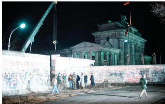
90年代以后共产国家纷纷解体。图为1989年，共产集权产物——柏林墙正被拆除。

有人会说，我什么也不信，我早就不信马克思主义了，我不信神也不信魔。这恰恰是马克思主义宣传无神论起到的效果：一个人可以在不知道撒旦教存在的情况下成为一个撒旦教徒，因为他反对信神，用完全唯物论的观点生活，否定信仰和道德准则。相信无神论本身就是选择了魔的意识形态、背离神的选择，被魔操控而不自知。