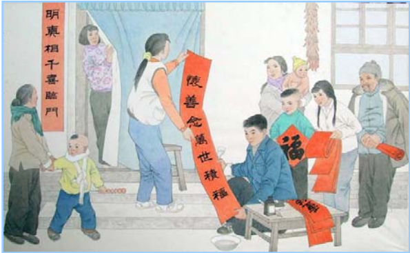
绘画《明真相千喜临门 怀善念万世积福》

我原认为的高尚都是伟大的人物、辉煌的事迹和深奥的理论，可是我错了。高尚是一种境界——先他后我、舍己为人、无私无畏。这是不能用世俗的财富、学识和成就来衡量的。想想身边的朋友，他每天看的《转法轮》都是教人要处处为人考虑，要宽容待人，要慈悲于人。天长日久读这本书的人，当然就会自觉地在言行中先他后我，在利益中舍己为人，在危险中无私无畏。